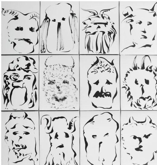
Mircea Cantor, Masks, encre sur papier, 2018 série de 30 dessins, 29,7x42cm chaque ©Mircea Cantor

Les œuvres contemporaines des artistes issus de l' École de Cluj . La Transylvanie est plus connue du grand public pour être la terre natale du comte Dracula. Mais elle est également un foyer artistique actif avec la présence de l'Université d'Art et d'esthétique de Cluj-Napoca. Celle-ci a maintenu, sous le règne de Ceausescu et au-delà, une tradition académique, un apprentissage du « métier » que certains artistes qui en sont issus (comme Mircea Cantor) ont su mettre à profit pour une création originale. Si la peinture semble être l'un des médiums les plus prisés de ces artistes, leurs travaux ne peuvent se résumer par un vocable unique. Il semble toutefois que leurs sujets privilégient l'histoire, la mémoire et la relecture des avant-gardes. Dans son exposition, dans l'espace « Camera de oaspeți » (Chambre d'amis) situé au dernier étage, Mircea Cantor a demandé à ses collègues qui forment cette scène effervescente de Cluj, de produire des œuvres en lien avec les thèmes du musée de la Chasse et de la Nature. Il a ainsi invité différentes générations d'artistes telles que Marius Bercea, le maître Corneliu Brudașcu, Dan Beudan, Mi Kafkin, Alin Bozbiciu, Sorin Câmpan, Gheorghe Ilea, Ciprian Mureșan, Radu Oreian, Eugen Roșca, Șerban Savu, Gabriela Vanga, à rejoindre la parade. Disséminées dans les salles du musée, leurs œuvres viendront s'insérer parmi les peintures de Chardin, Desportes, Oudry et celles des grands artistes français qui ont illustré la chasse.