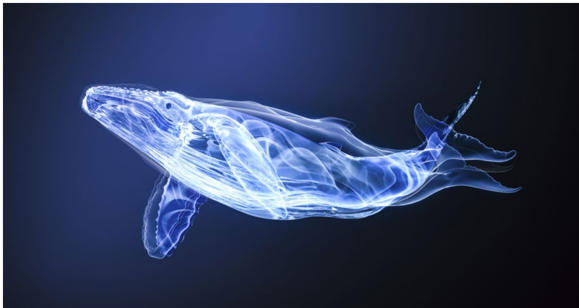
Baleine fantôme, [Balæna phantasma], Mémoire de la constellation Auctus animalis, 130 x 75 cm, impression jet d'encre papier, 2022