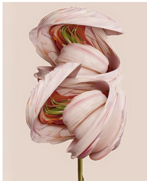
Rosa incognita, 60x90 cm, impression jet d'encre papier, 2022 © V. F.

Au cœur du musée « Uchronie » invite ainsi le visiteur à embarquer aux côtés de Vincent Fournier dans un voyage au-delà du réel. > UCHRONIE.EU