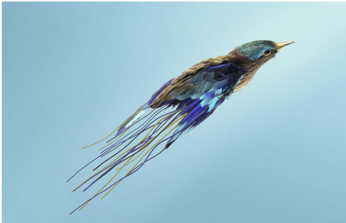
Oiseau tempête [Coracias tempestari], Contrôle les phénomènes célestes en faisant usage de la musique, 75x53 cm, impression jet d'encre papier, 2022 © Vincent Fournier

Comme le rappelle l'artiste, « ma fascination pour l'espace vient sans aucun doute de l'imaginaire futuriste des années 70 et 80 – films et séries télévisées, romans de science-fiction, documentaires – qui se sont mélangés et superposés dans ma mémoire, à la manière d'une rencontre improbable entre Tati et Jules Verne dans la station spatiale du film 2001, l'Odysée de l'espace de Stanley Kubrick. » La muséographie de l'exposition est d'ailleurs un clin d'œil à cet incontournable de la science-fiction où les époques se télescopent et s'associent.