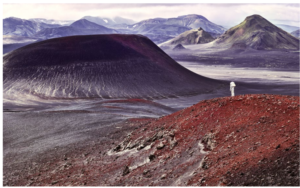
Iceland Moon Mars Simulation #1, MS2 Spacesuit, ISE, 150x200 cm, impression jet d'encre papier, 2021 © Vincent Fournier

COMMUNICATION DU MUSÉE Benjamin Simon, responsable de la communication b.simon@fondationfrancoissommer.org